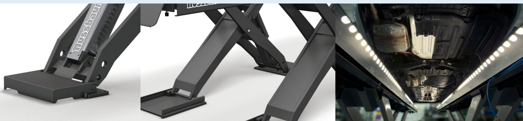
Crémaillère de sécurité