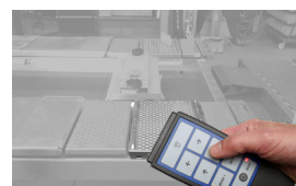
Gelenkspieltester mit Fernbedienung